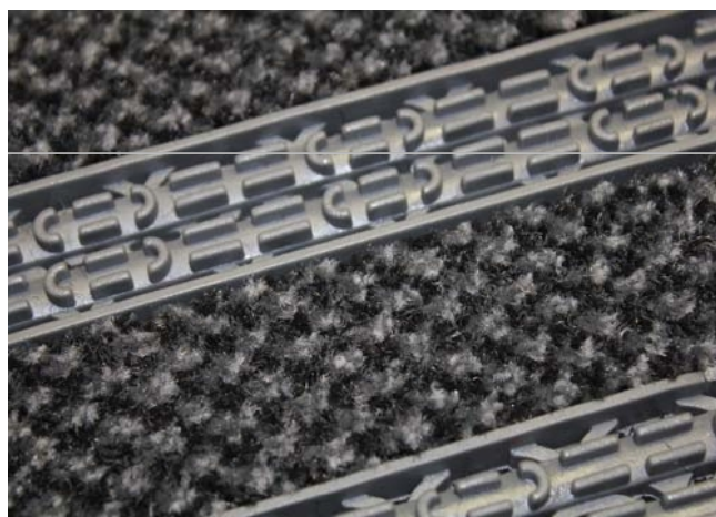
A betét színei fekete és szürke.